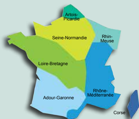
Les 7 bassins hydrographiques métropolitains

Pour reconquérir le bon état des eaux demandé par la directive cadre sur l'eau, les agences de l'eau recherchent la meilleure efficacité environnementale,